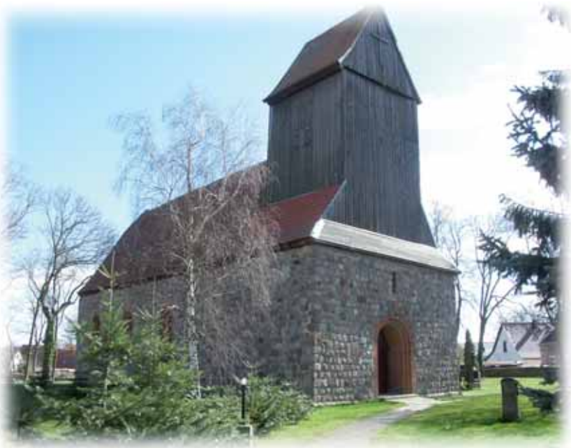
Kirche in Groß-Pinnow

Auf Wunsch erstellen wir Ihnen natürlich auch gern eine individuelle Preiskalkulation, speziell für Ihre Feier und entsprechend Ihren Vorstellungen.