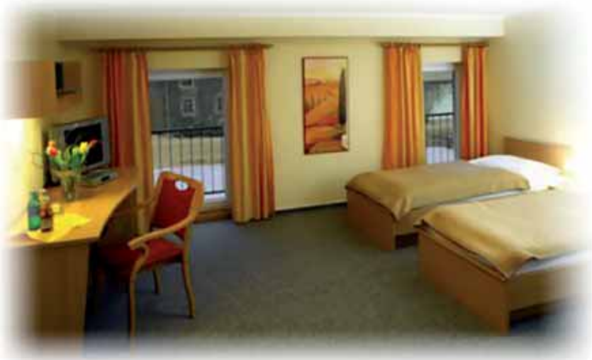
Zimmer mit gehobenem Standard